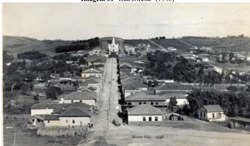
Imagem 01 “Rua Direita” (1948)

A cidade de Monte Sião – MG, é por natureza, uma cidade com fortes raízes no turismo, sendo historicamente uma grande incentivadora do comércio local, procurando atrair cada vez mais visitantes para movimentar sua economia. Este interesse é confrontado por diversidades que limitam o progresso do município em certos aspectos, assim como a degradação de locais históricos. Estes que poderiam estar gerando engajamento nacionalmente, ou mesmo proporcionando maiores comodidades a população, porém estão inertes e/ou desaproveitados. Entre eles, está a primeira rua do município, que hoje é denominada de “Rua Presidente Tancredo Neves”, conhecida popularmente como “Rua Direita”.