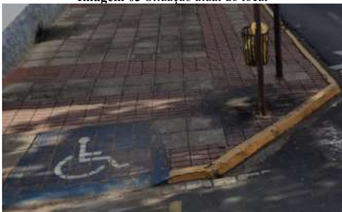
Imagem 03 Situação atual do local

Esta via está de frente com a principal praça central, fazendo “sala” aos turistas que visam frequentar outros monumento históricos, a Praça “Prefeito Mário Zucato” ou o “Santuário Nossa Senhora da Medalha Milagrosa”. Logo, a deterioração ilustrada pelas imagens abaixo, de um local com tamanha visibilidade traz malefícios que estão em desacordo com o interesse público.