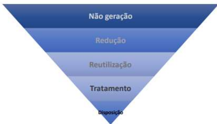
Imagem 13 Sustentabilidade em Obras e Serviços de Engenharia