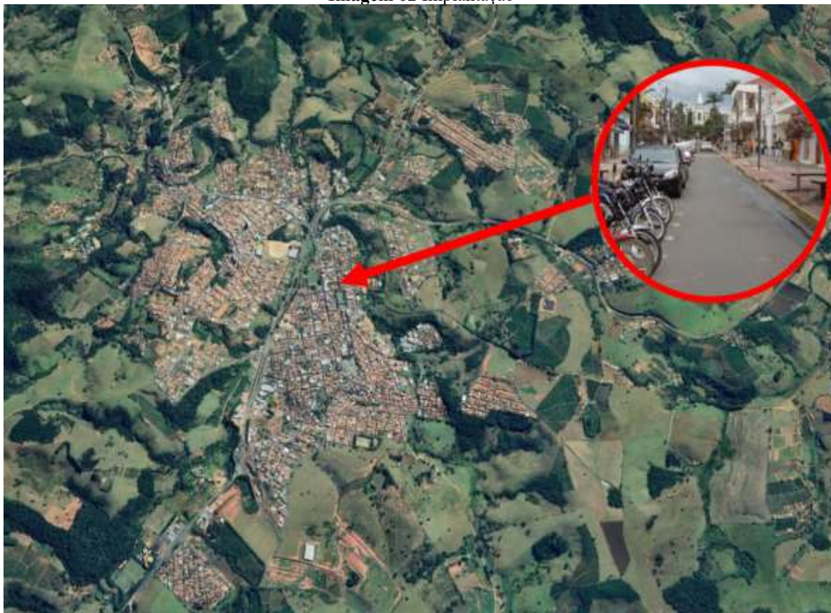
Imagem 02 Implantação

Rua Maurício Zucato, 111 – Centro, Monte Sião/MG. CEP 37580-000 Telefone (35) 3465-4600 – e-mail: nucleocompras@montesiao.mg.gov.br