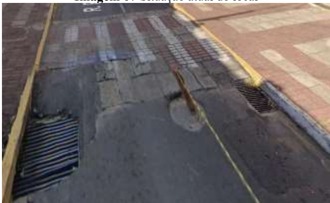
Imagem 07 Situação atual do local