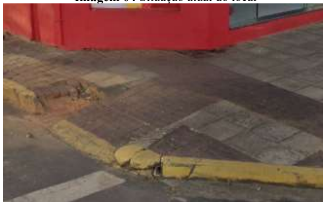
Imagem 04 Situação atual do local