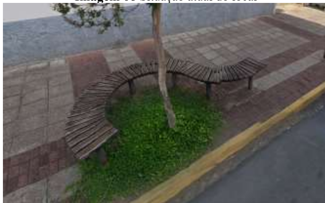
Imagem 06 Situação atual do local