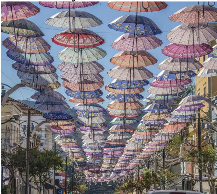
Imagem 12 Enfeites da “Rua Direita”

Para tanto, no exercício de 2025, foi feita a contratação de empresa para prestação de serviços de confecção e instalação de guarda-chuvas coloridos na Rua Presidente Tancredo Neves. O que a tornou em um ponto "instagramável", que junto aos restaurantes locais, faz sucesso entre os transeuntes.