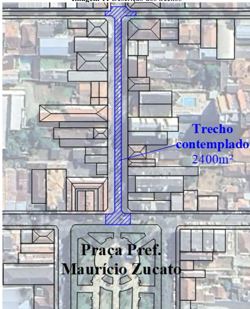
Imagem 11 Descrição dos trechos