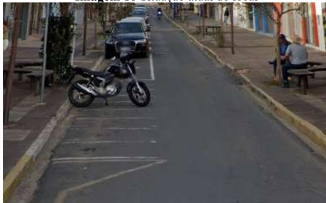
Imagem 10 Situação atual do local