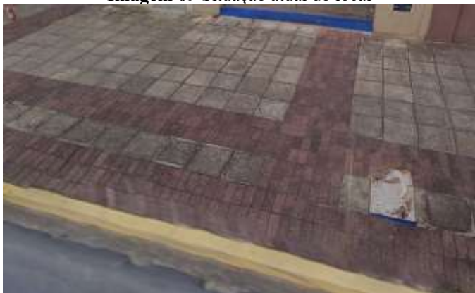
Imagem 09 Situação atual do local