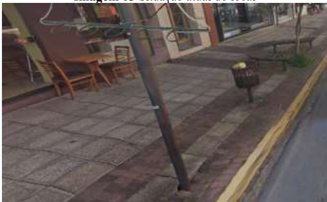
Imagem 05 Situação atual do local

Rua Maurício Zucato, 111 – Centro, Monte Siao/MG. CEP 37580-000 Telefone (35) 3465-4600 – e-mail: nucleocompras@montesiao.mg.gov.br