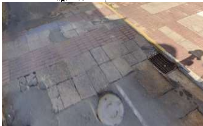
Imagem 08 Situação atual do local